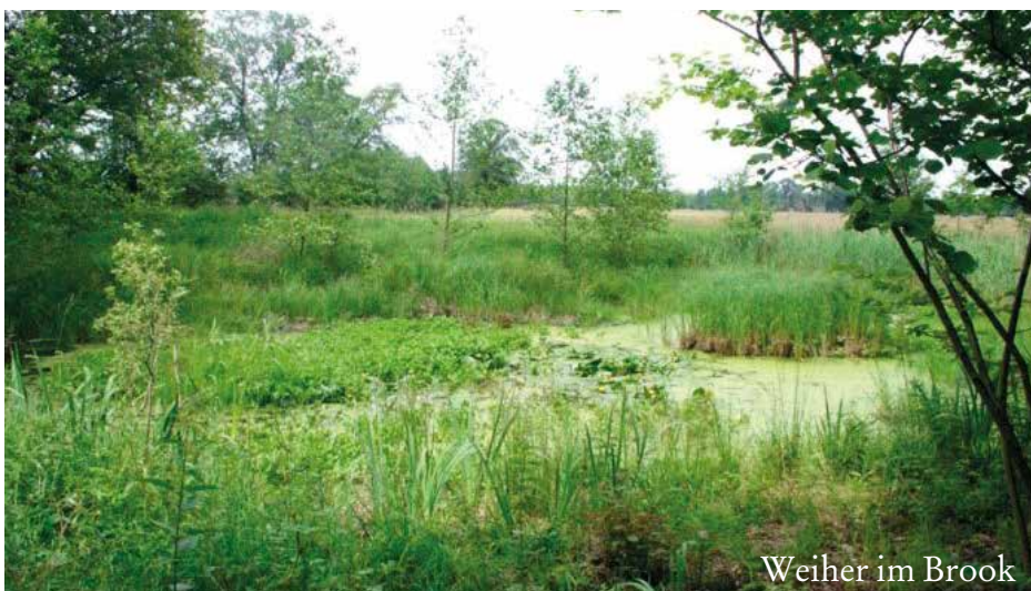
Weiher im Brook

Jümmers weniger heet dat nu „Bi Karstadt op’n Grabbeldisch“, jo dat is all een schlimme Sook, besünners för de Lüüd de jümmer Arbeitsplatz verleeren doot. Man ok veele Hamburger warrt wat fehlen, wenn dat Karstadt bi jüm op de Eck nich mehr gifft. Man nich nur Karstadt warrt veele Lüüd fehlen, veele lütte Lodens hebbt to mookt. Leve Lüüd goht ok wider in een Geschäft tum inkeupen, nich allens „Online“ bestellen. Veele Lüüd verleert jümmer Existenz un een Stadtbummel warrt jümmers langwiliger wenn dat jümmers weniger lütte Lodens gifft. Annermol mehr Jochen