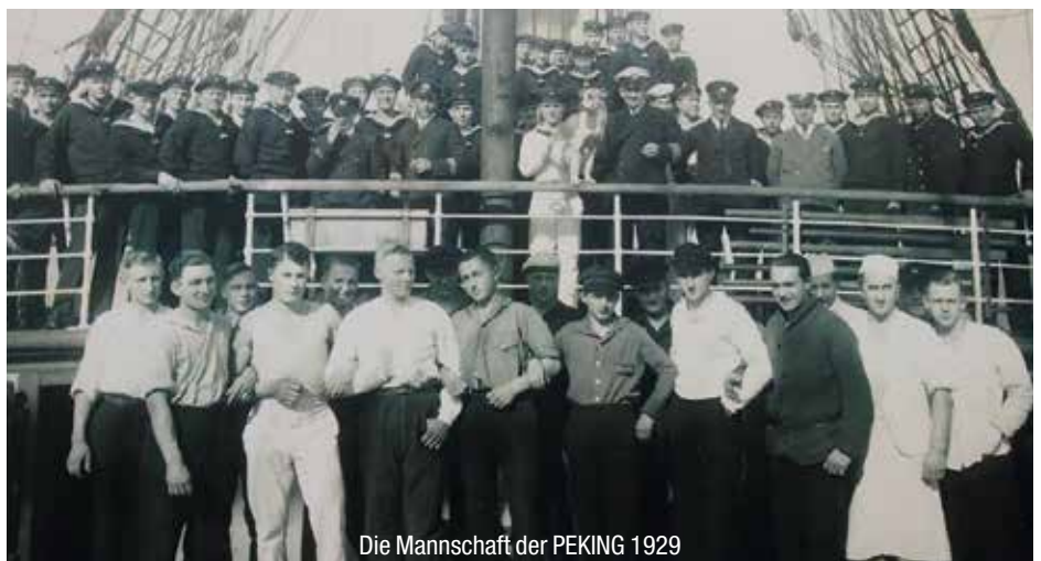
Die Mannschaft der PEKING 1929

Eine kurze Pause war nun angebracht und dann ging es in den zweiten Teil der Seereise nach Südamerika. Als die Peking mit dem letzten Rest des Films in Chile mit einem schönen Sonnenuntergang nach einer für die Mannschaft entbehrungsreichen und auch stürmischen Zeit angekommen war, stellte Herr Kahl noch einen